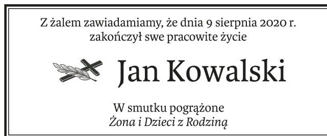
Nekrolog z wyróżnieniem