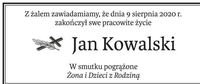
Nekrolog z wyróżnieniem