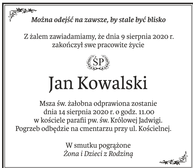
Nekrolog z wyróżnieniem i ornamentem