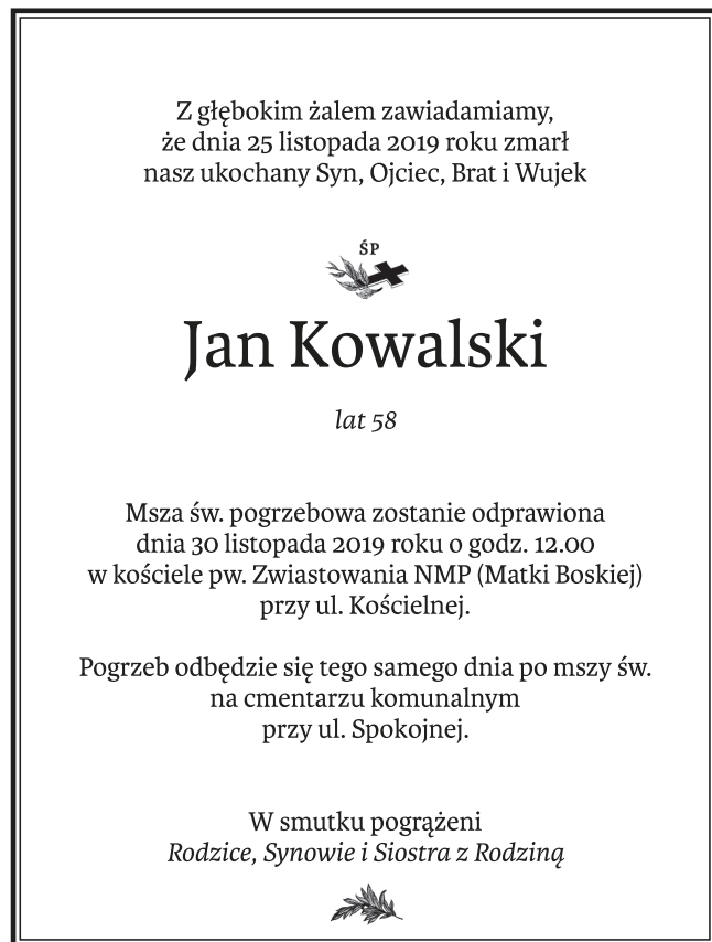
Nekrolog z wyróżnieniem i ornamentem