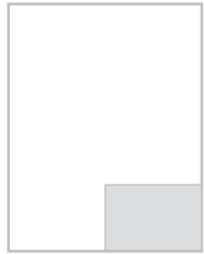
1/8 strony na spad 100,5x64,5 mm + 5 mm spad