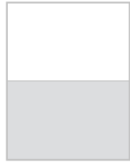
1/2 strony na spad 205x132,5 mm + 5 mm spad