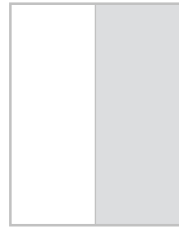
1/2 strony na spad 100,5x275 mm + 5 mm spad