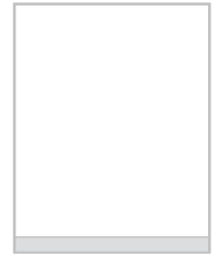
baner na spad 205x15 mm + 5 mm spad